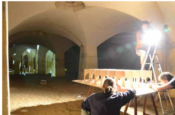
Überprüfung und Bildfindung im Filter