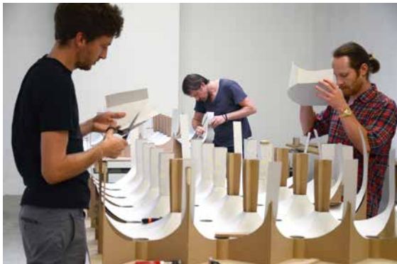
Die Kunstschaffenden am Modellbau im Projektraum

Das Filtern oder Transformieren entspricht im Grundkern der ursprünglichen Funktion einer Filteranlage, welche in diesem Fall stillgelegt und durch die Intervention der Künstler in einer Abgewandelten Form wieder zum Wirken kommt.